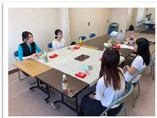
参加してくれた4名の学生