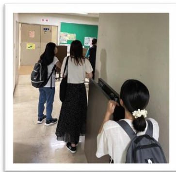
3号館から1号館へ机を移動

参加した学生からは、『普段なかなか話す機会がない学生同士でいろいろな話ができて良かった』、『交流を持てたことで次回の活動が楽しみになった』等の声が聞かれました😊