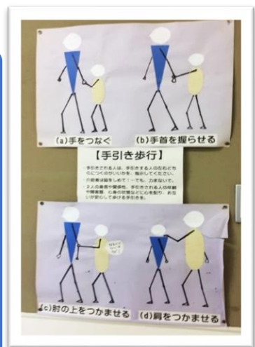
沖縄盲学校展示物 (許可済み)

【手引きされる人の年齢や障がい歴、心身の状態などに心を配り、お互い安心して歩ける手引きを。】